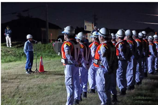
副所長の挨拶(旦ノ島陸閘)