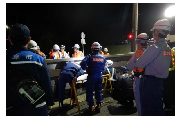
陸閘設備点検状況(尻毛第一陸閘)