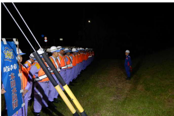
副所長の挨拶(尻毛第一陸閘)