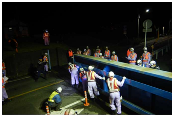
陸閘閉鎖状況(旦ノ島陸閘)